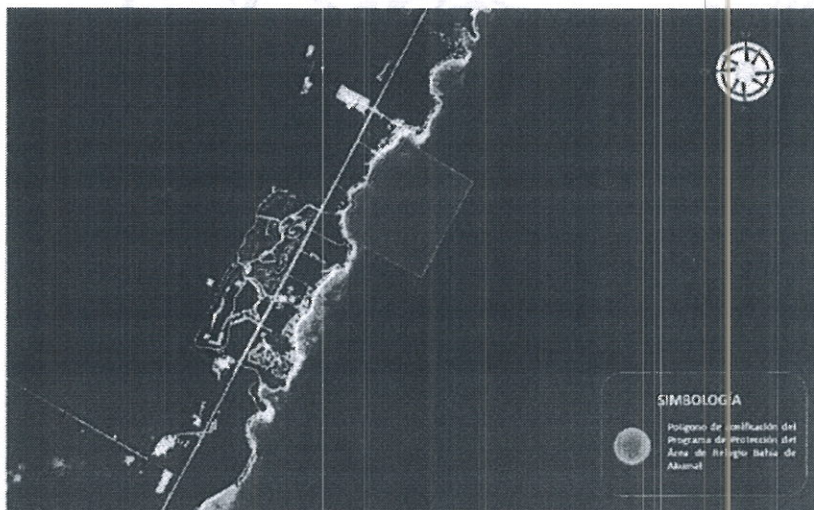
Figura 1.- Propuesta del polígono de afectación para el "Área de Refugio Bahía Akumal"

En cuanto a las Zonas externas a la Bahía de Akumal, se solicita DESAPAREZCAN del polígono de refugio del programa, dado los resultados presentados por la CONANP, y discutidos en las mesas de trabajo, en que se reforzó la noción de que sólo en zonas internas de la bahía habita la tortuga por la presencia de parches de pastos, tal y como se muestra en la siguiente imagen.